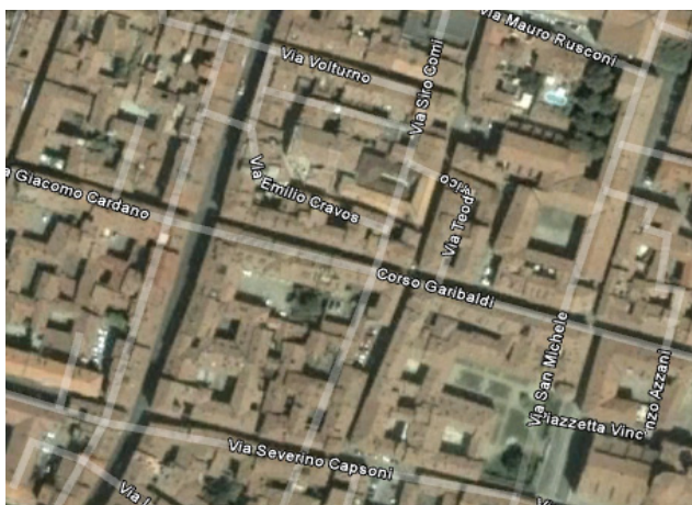
Figura 1 – Esempio di sovrapposizione tra il layer della viabilità e l'immagine satellitare georeferenziata, in Google Earth.

Vi è infine un esempio relativo alla città di Pavia, che è all'origine dell'approfondimento descritto nella nota. Se si accende il layer della viabilità e si aumenta il rapporto di zoom nella finestra di visualizzazione, le linee indicanti le strade si allontanano progressivamente dalla posizione che le strade stesse occupano sull'immagine di sfondo e si sovrappongono ai tetti ( Figura 1 ). Ciò indica un errore di georeferenziazione di uno dei due layer visualizzati e il maggior indiziato è l'immagine raster, in quanto il layer della viabilità è fornito a Google dalle ditte che si occupano di navigatori per automobili e difficilmente può contenere errori così grandi.